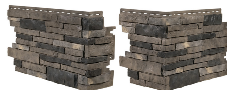
Coin aLL-Pro - Disponible dans toutes les couleurs